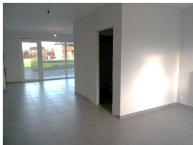
Vue depuis l'arrière