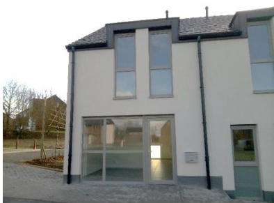
Vue d'ensemble / vitrine (RDC)