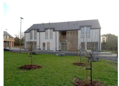
Vue générale et environnement