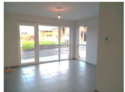
Vue vers l'avant