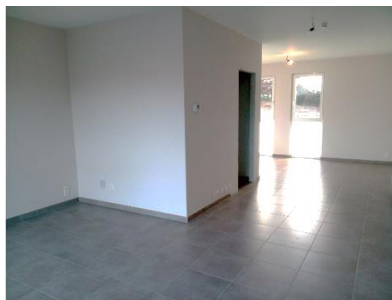
Vue depuis l'entrée