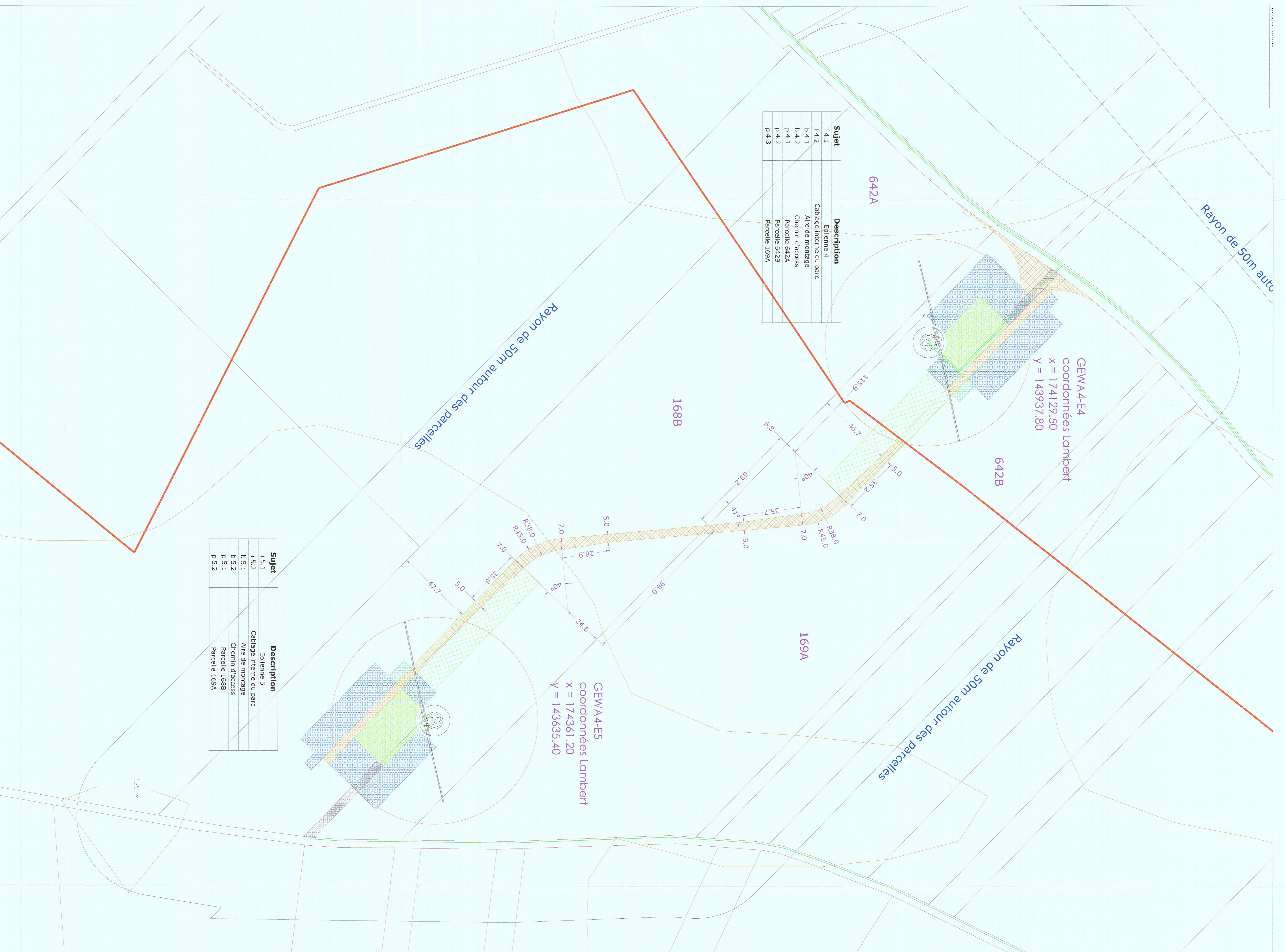
PLAN D'IMPLANTATION INDIVIDUEL EOLIENNES 5 ET 4 (1/1000)