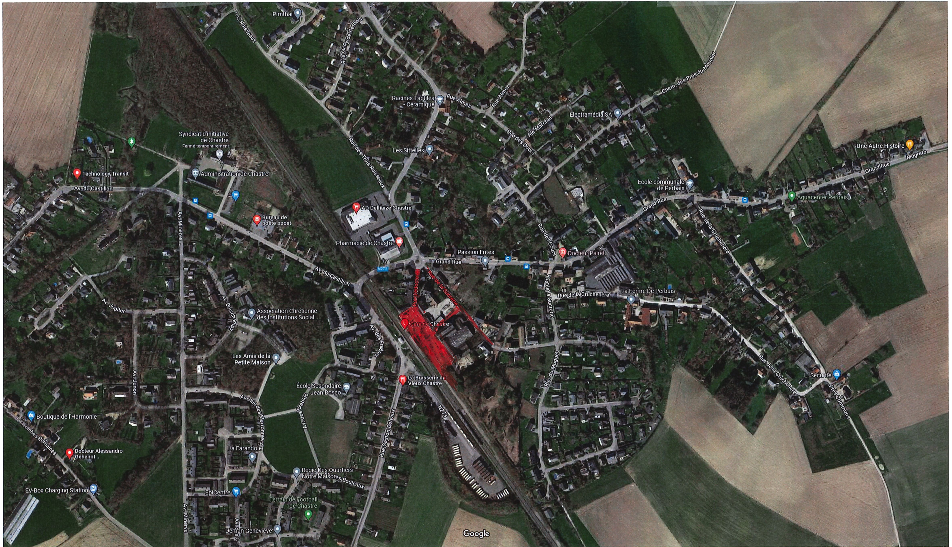
Schéma général du réseau des voiries dans lequel s'inscrit la demande

Images ©2022 Google, Images ©2022 CNES / Airbus, Maxar Technologies, Données cartographiques ©2022 50 m