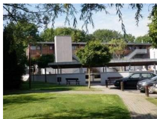
Implantation de Walhain Place communale, 2 010/65.83.16