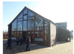
Implantation de Perbais Grand'Rue, 45 010/65.53.56