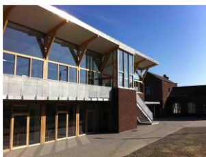
Implantation de Tourinnes Rue d'Enfer, 5-7 010/65.50.56

Infos: Delphine BRICART, Directrice : Tél. 010/65.83.16 – Gsm. 0472/55.44.20