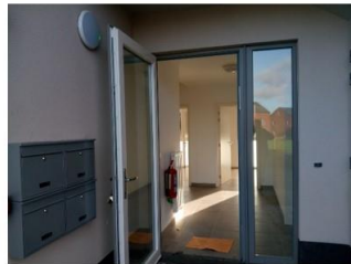
Entrée des cabinets