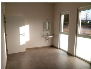
Cabinet 1 – arrière – 15 m²