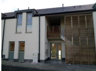
Vue d'ensemble des cabinets (RDC)