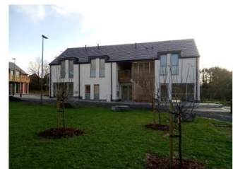
Vue générale et environnement