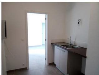
Espace privé / cuisine