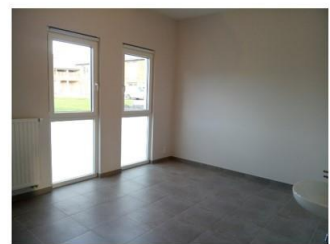
Cabinet 3 – avant – 18 m²