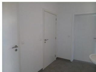
Sanitaires (dont un PMR)