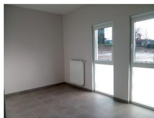
Cabinet 2 – arrière – 15 m²