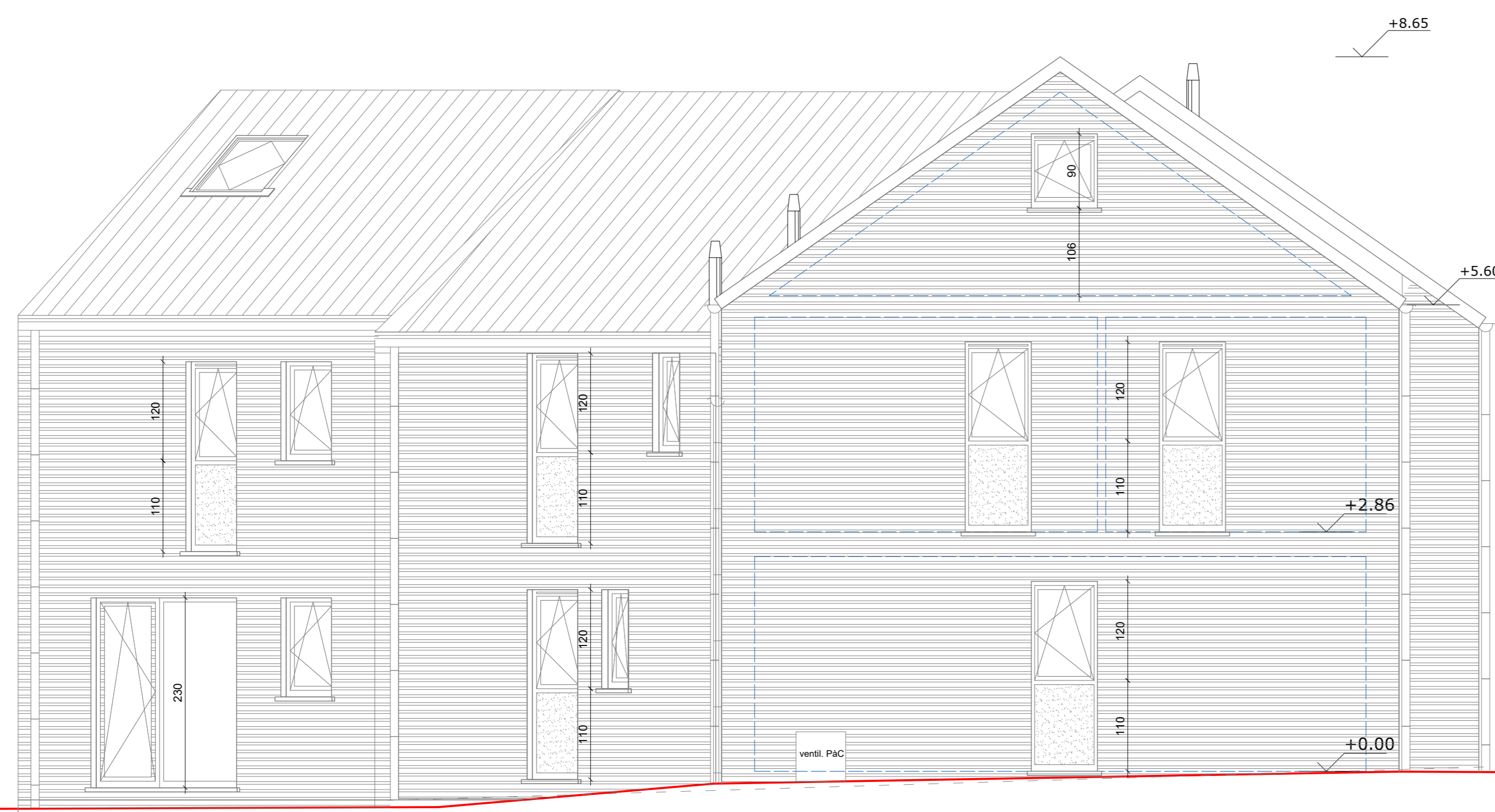
FACADE LATERALE GAUCHE - 1/50